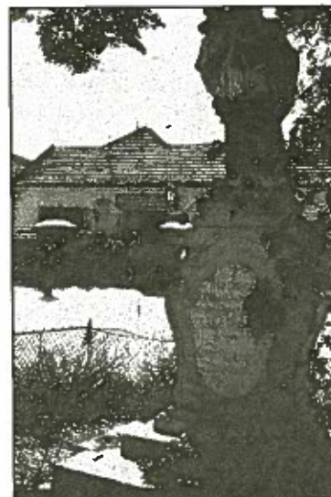
Popálený inžinier ešte odišiel z krčmy po svojich.