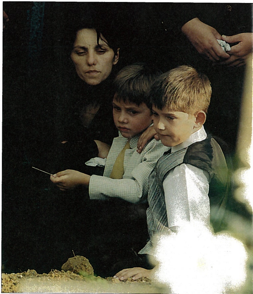
Šesťročný Sáraiov syn so žltou viazankou nechce spolu s mamou pochopiť dosah tragédie.

Sanitka Sáraia previezla do nemocnice v Nových Zámkoch. Manželka s dieťaťom