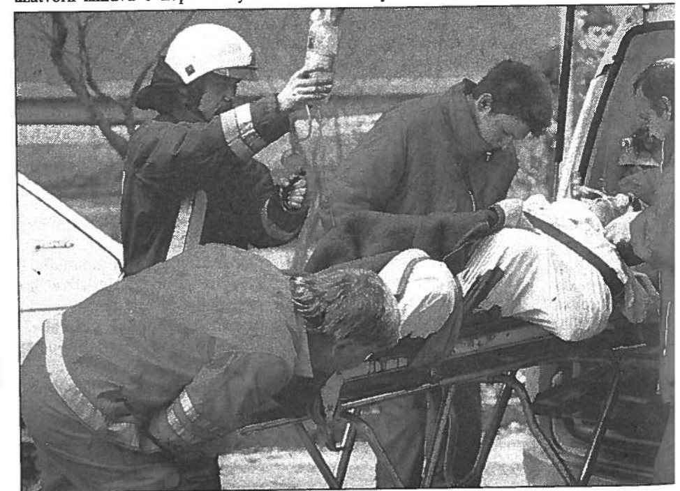
Explózia nástražného výbušného systému usmrtila v Bratislave na Lazaretskej ulici jednu osobu.